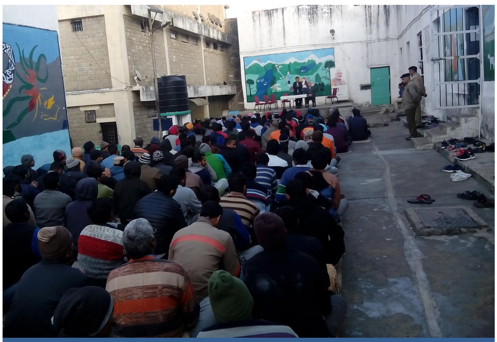
Awareness programme on Fundamental Duties and Legal Rights of Prisoners organized at Central Model Jail, Nahan for Jail Inmates.