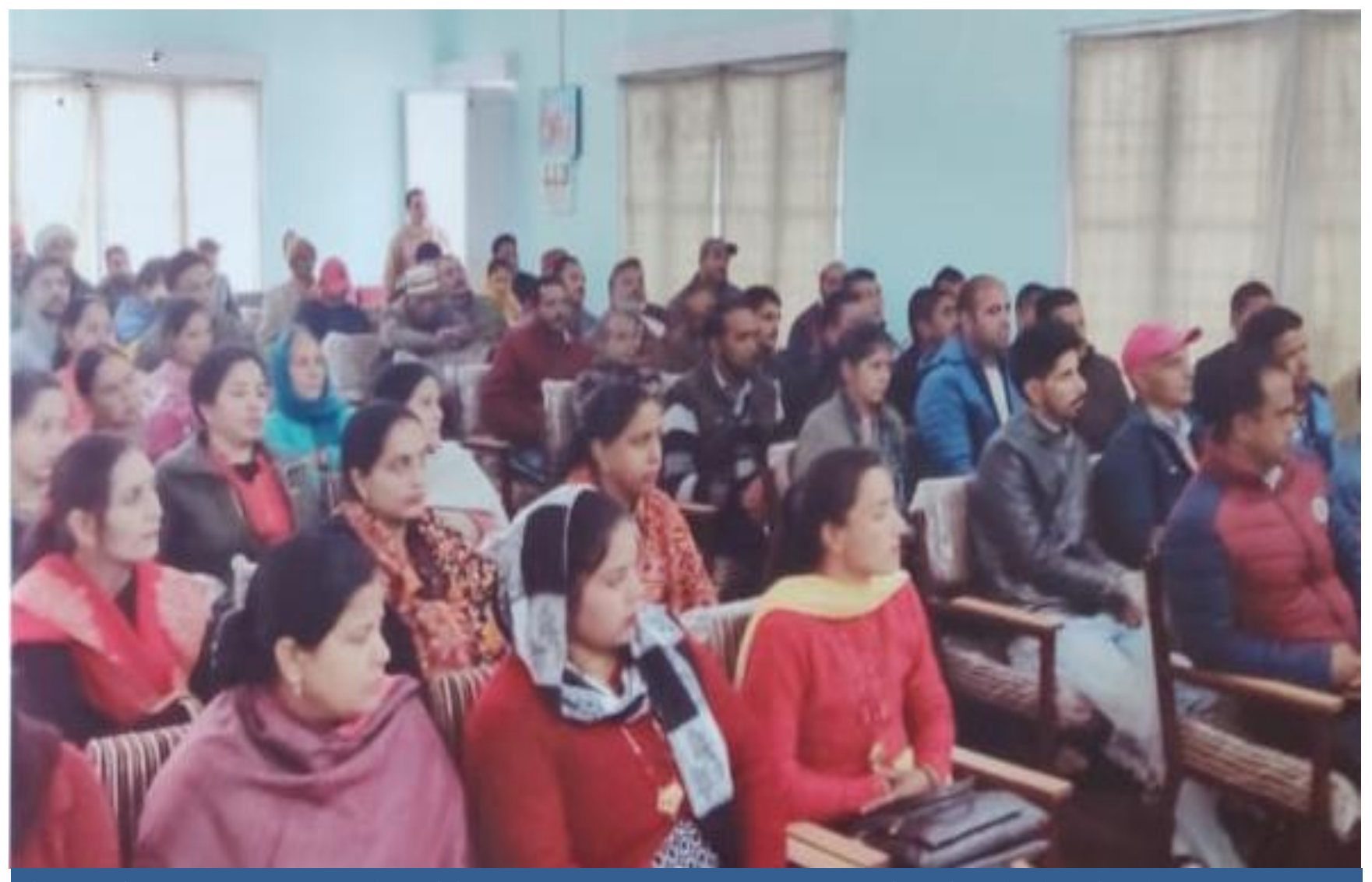
A meet of Panchayat representatives of Chamba Block and a Talk on Preamble of the Constitution of India, Fundamental Duties and Role of Panchayati Raj Institutions in upholding Human Rights.