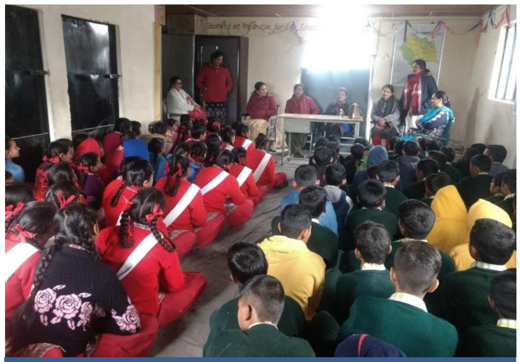
An Awareness Programme on Fundamental Duties organized at Govt. Senior Secondary School Mehli Shimla.