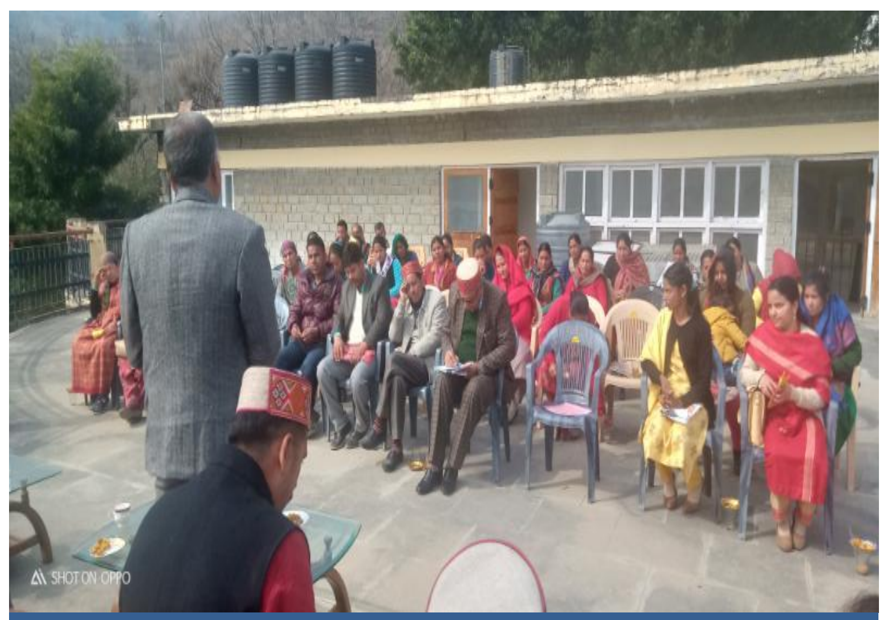
A Legal Awareness Programme on Fundamental Duties organized at GP Kalehali.