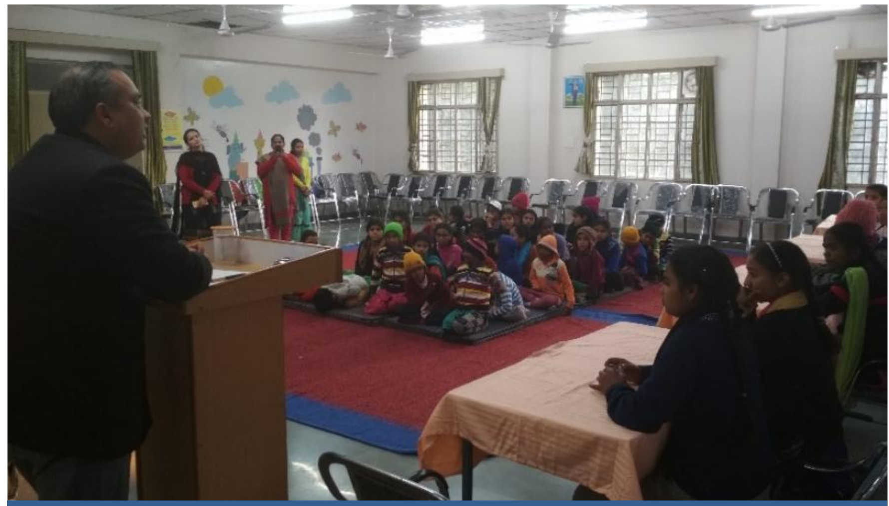
A Camp/ Quiz competition organised by Secretary, DLSA, Kangra at Dharamshala on Fundamental Duties in Balika Ashram Garli at Muhin, (Dehra) on 21/01/2020 in which 39 inmates participated. After competition inmates were addressed with special focus on Fundamental Duties.