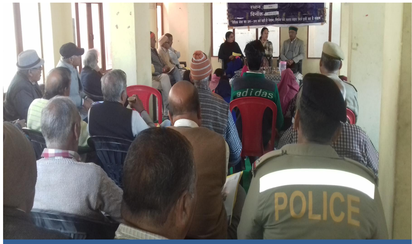
Public Awareness through Talks on Fundamental Duties at Gram Panchayat Batal.