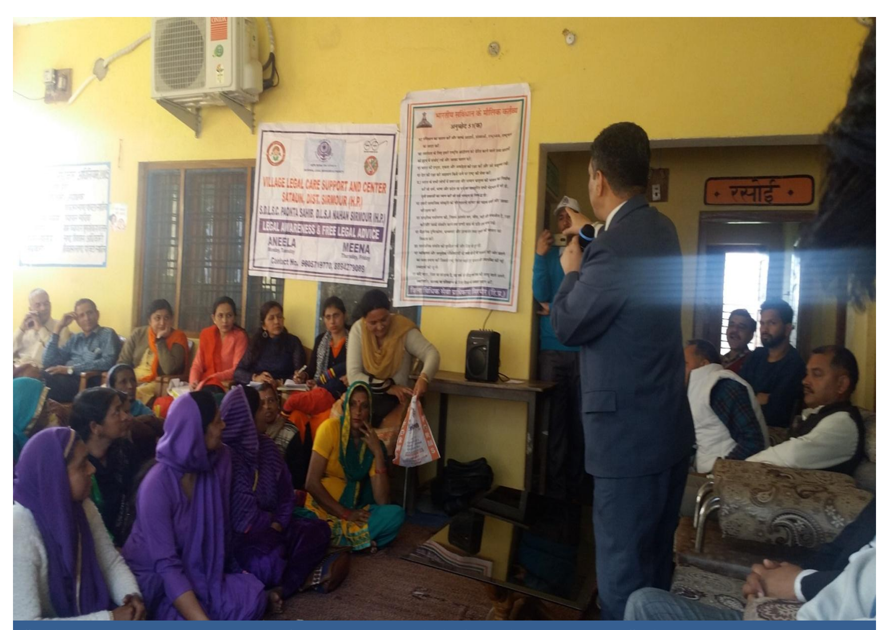
Special lecture on Fundamental duties for the general public in G. P. Nihalgarh, Paonta Sahib.