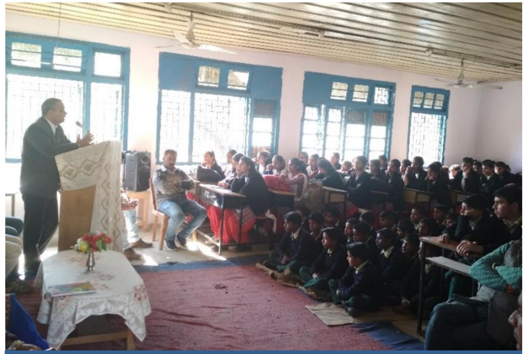
A camp on Fundamental Duties & 70<sup>th</sup> year of adoption of Constitution of India was organised by Secretary, DLSA, Kangra at Dharamshala in Govt. Model Sr. Sec. School, Dehraon 18/02/2020.