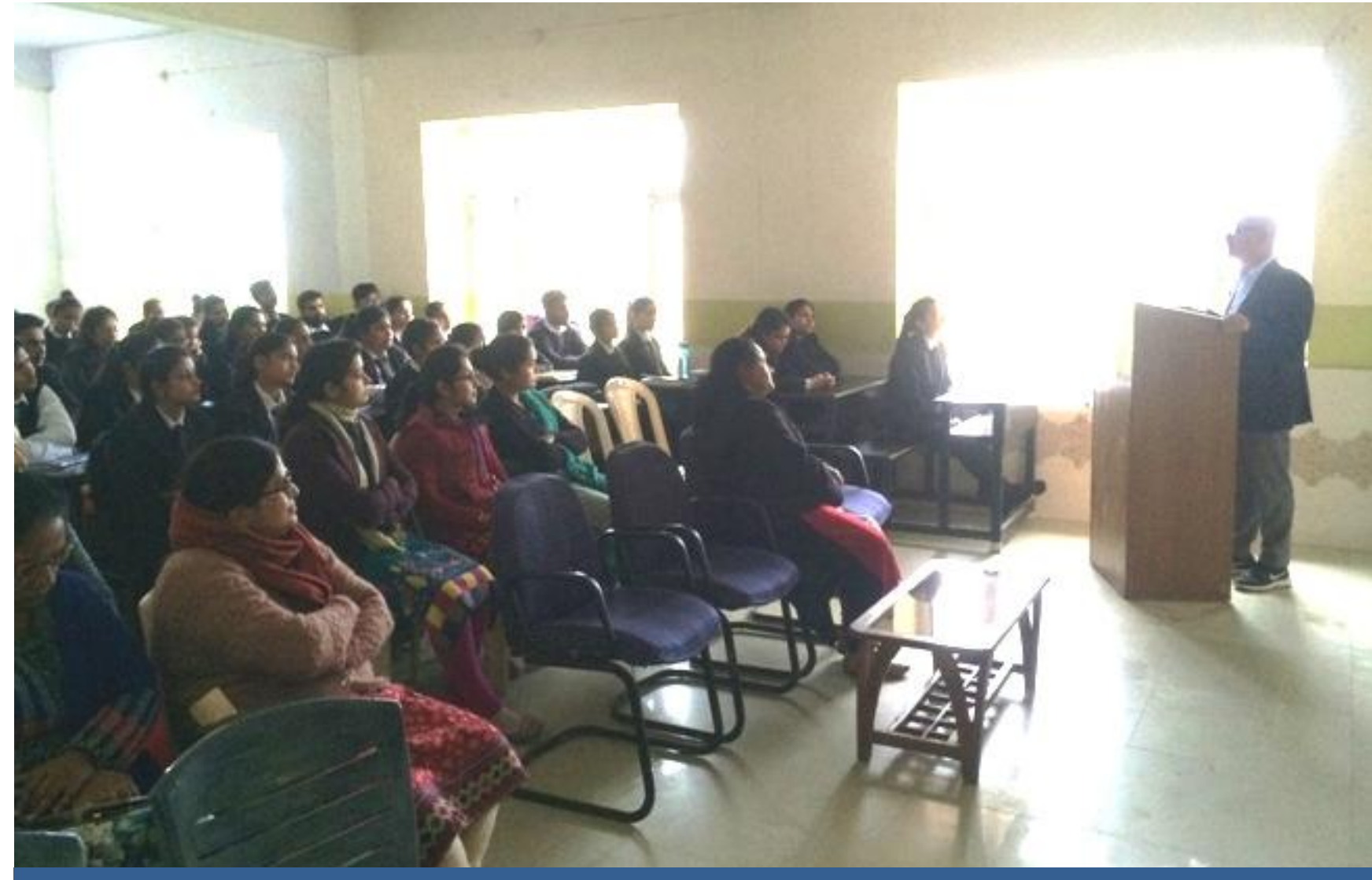
An awareness programme on Fundamental Duties organized at HIMCAMPES Law College, Badhera.