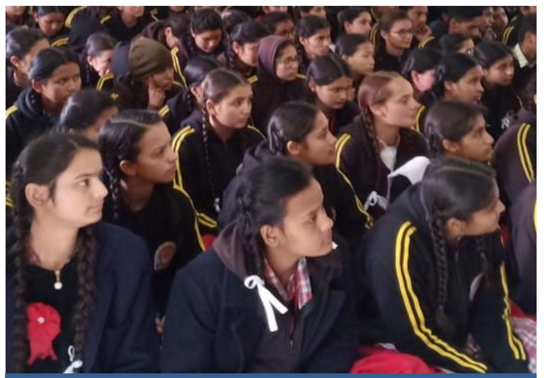
A Legal Literacy Programme on Fundamental Duties organized at GSSS (Girls), Rampur Bushehar.