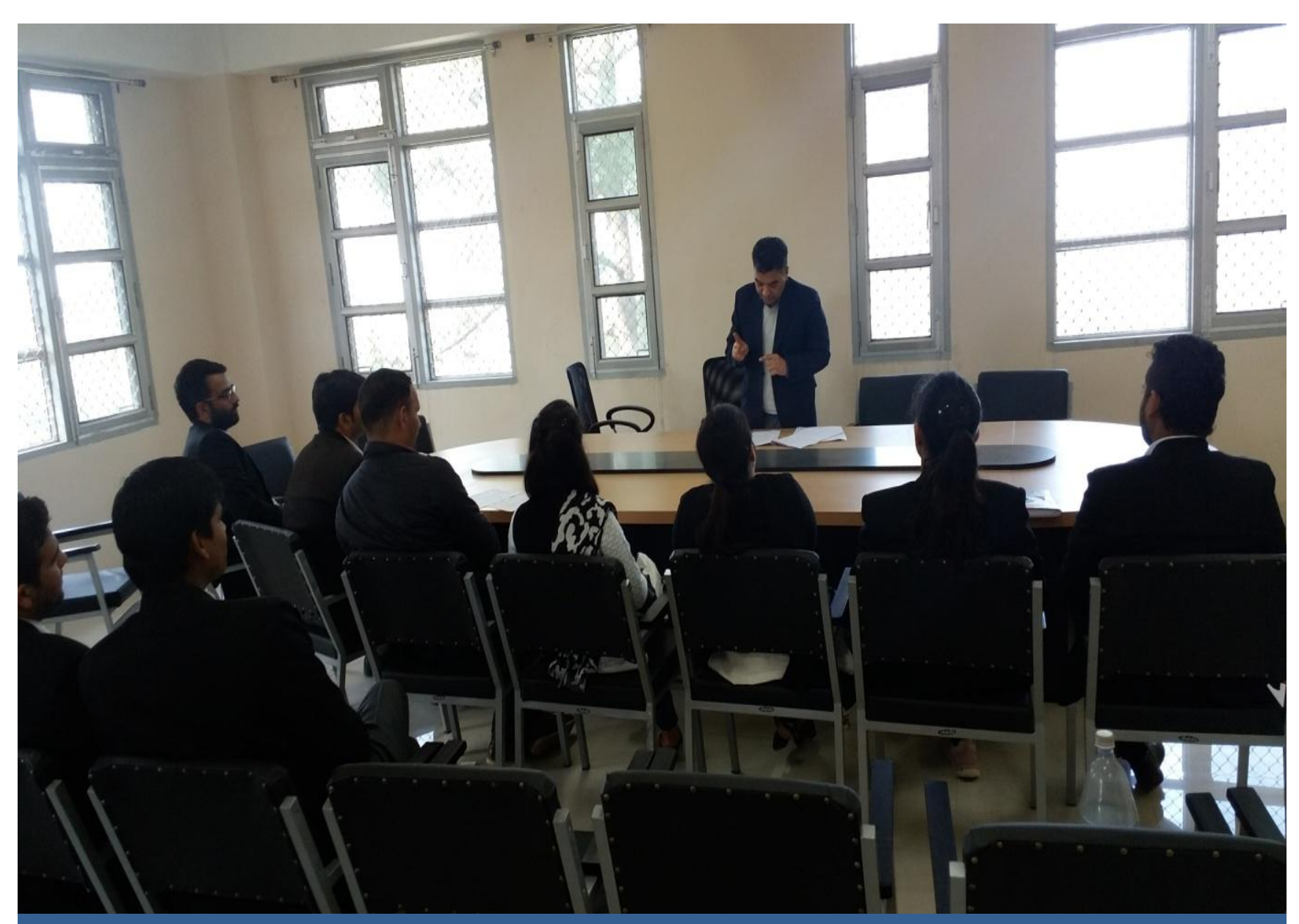
Remand Counsel was on Fundamental Duties.