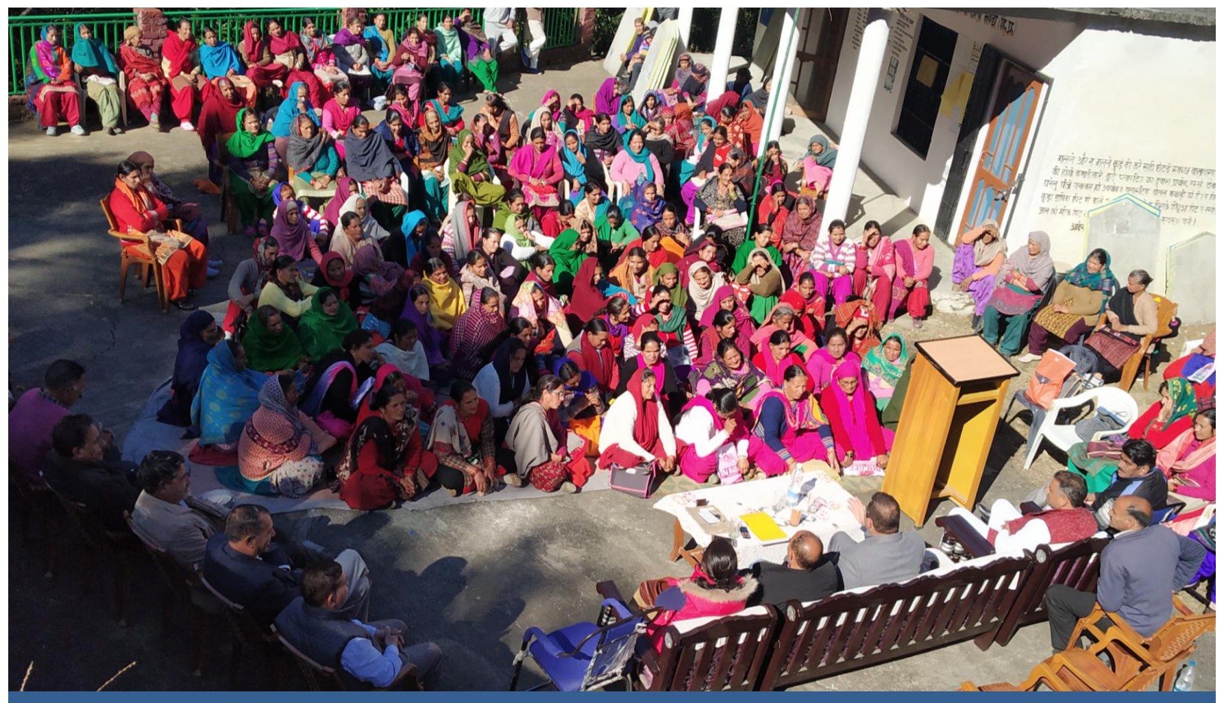
Legal Awareness Camp on Fundamental Duties organized at Pipli, Tehsil Jogindernagar and 170 persons attended the camp.