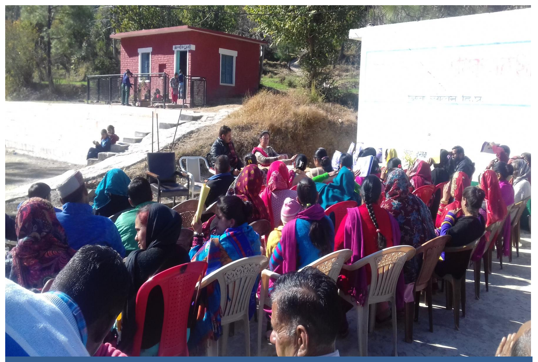
Public Awareness through Talks on Fundamental Duties at Gram Panchayat Gulhadi.