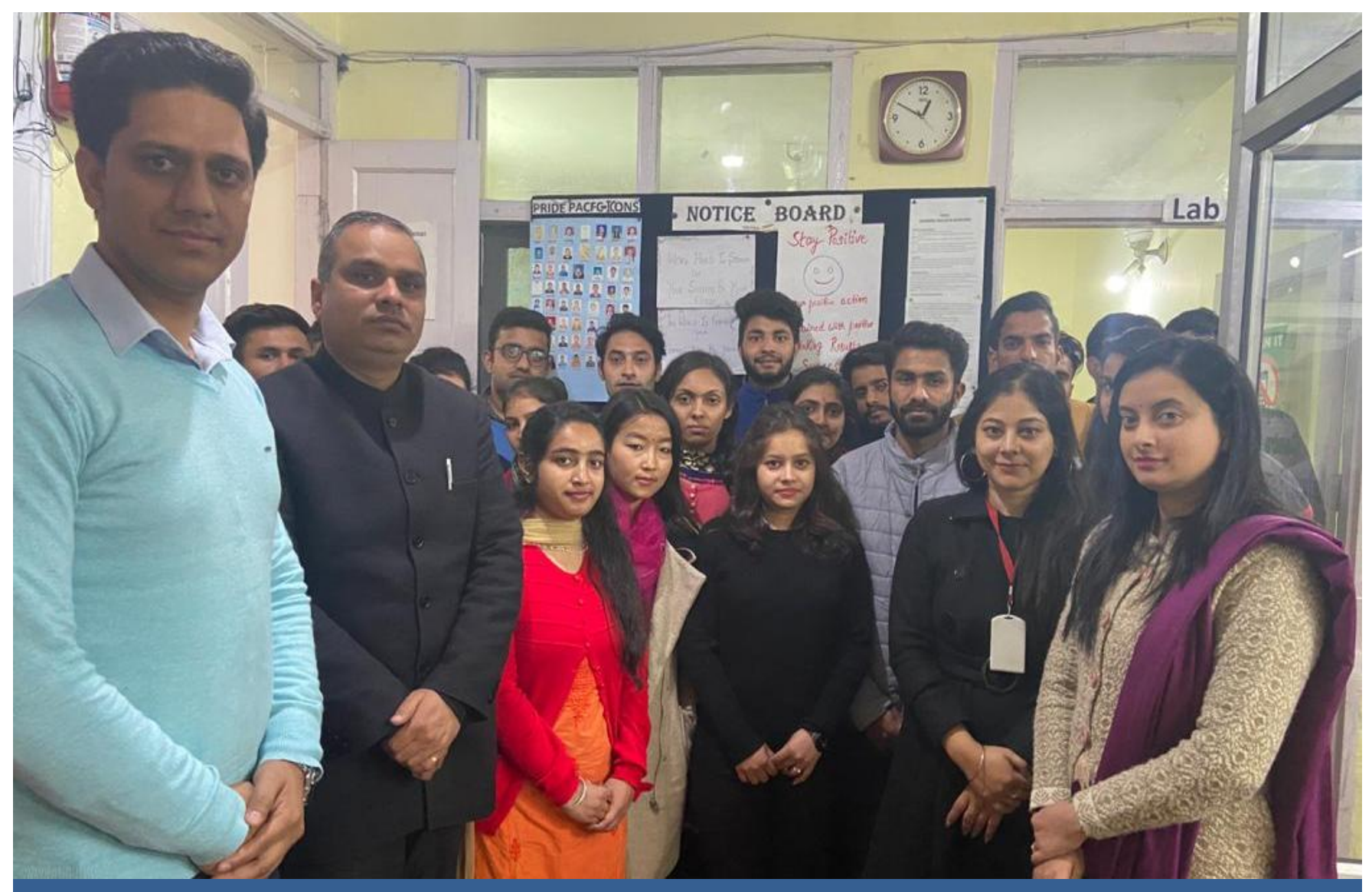
A Camp/Declamation on Fundamental Duties organized by Secretary, DLSA, Kangra at Dharamshala in PACFC, institute Dharamshala on 12/02/2020. After declamation students were addressed on Preamble of Constitution & Fundamental Duties.