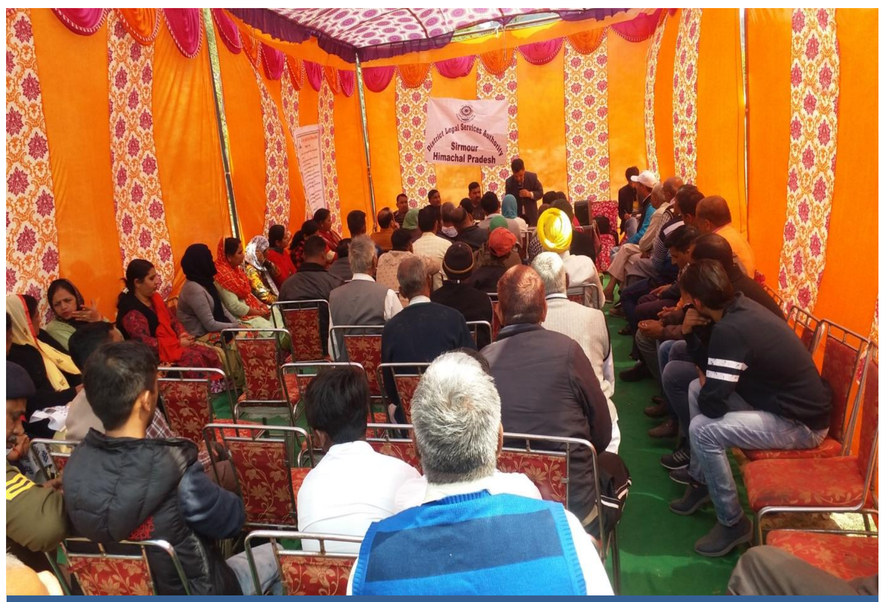
Awareness Programmes for Labourers on Fundamental Duties at Nahan.