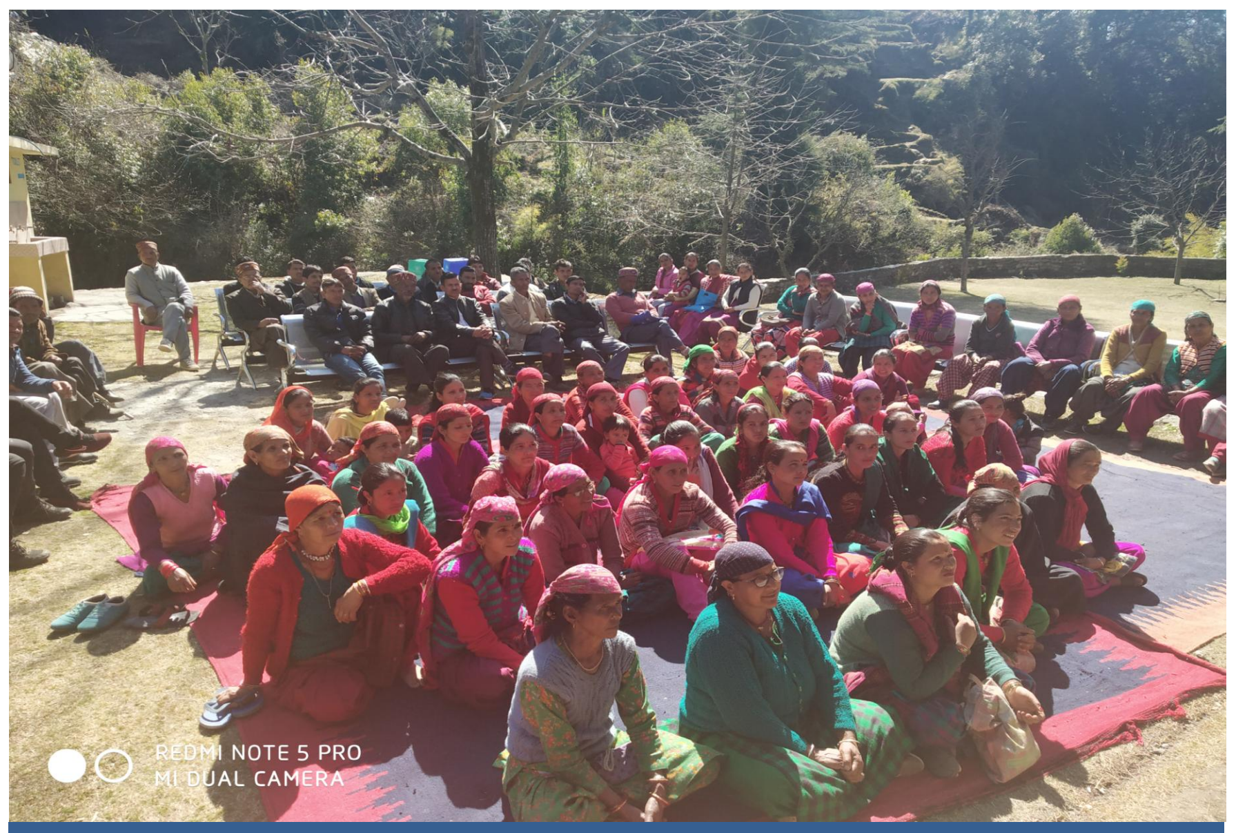
Legal Awareness Camp on Fundamental Duties at Thaltukhod, Tehsil Jogindernagar and 150 persons attended the camp.