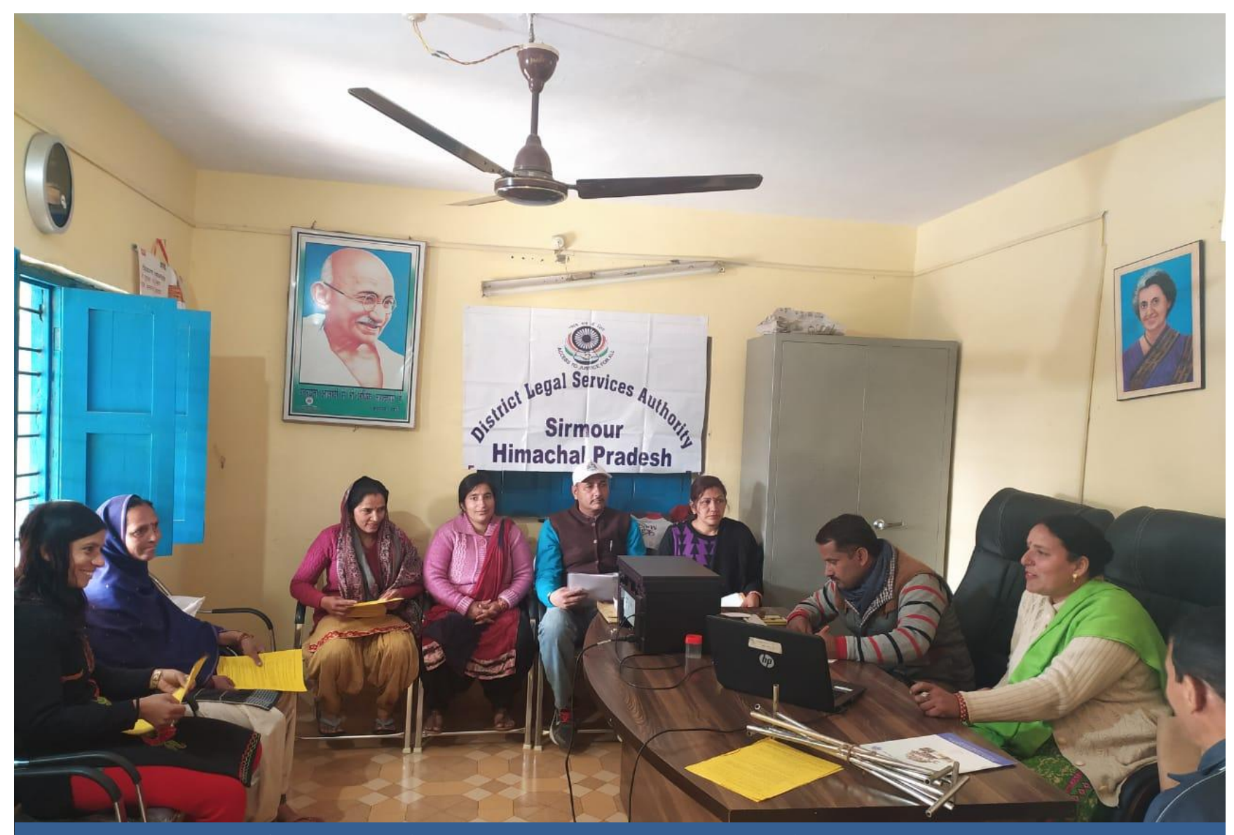
Awareness programmes for aanganwadi karyakarta and Panchayat representatives by the Para Legal Volunteer.