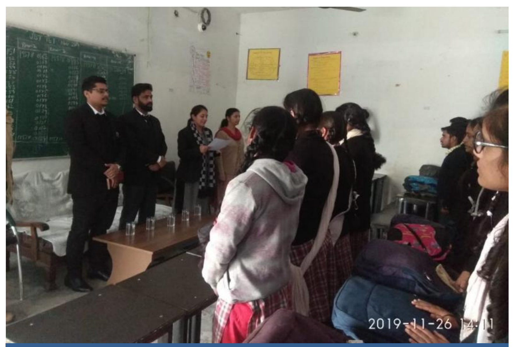
An awareness programme on Fundamental Duties for school students.