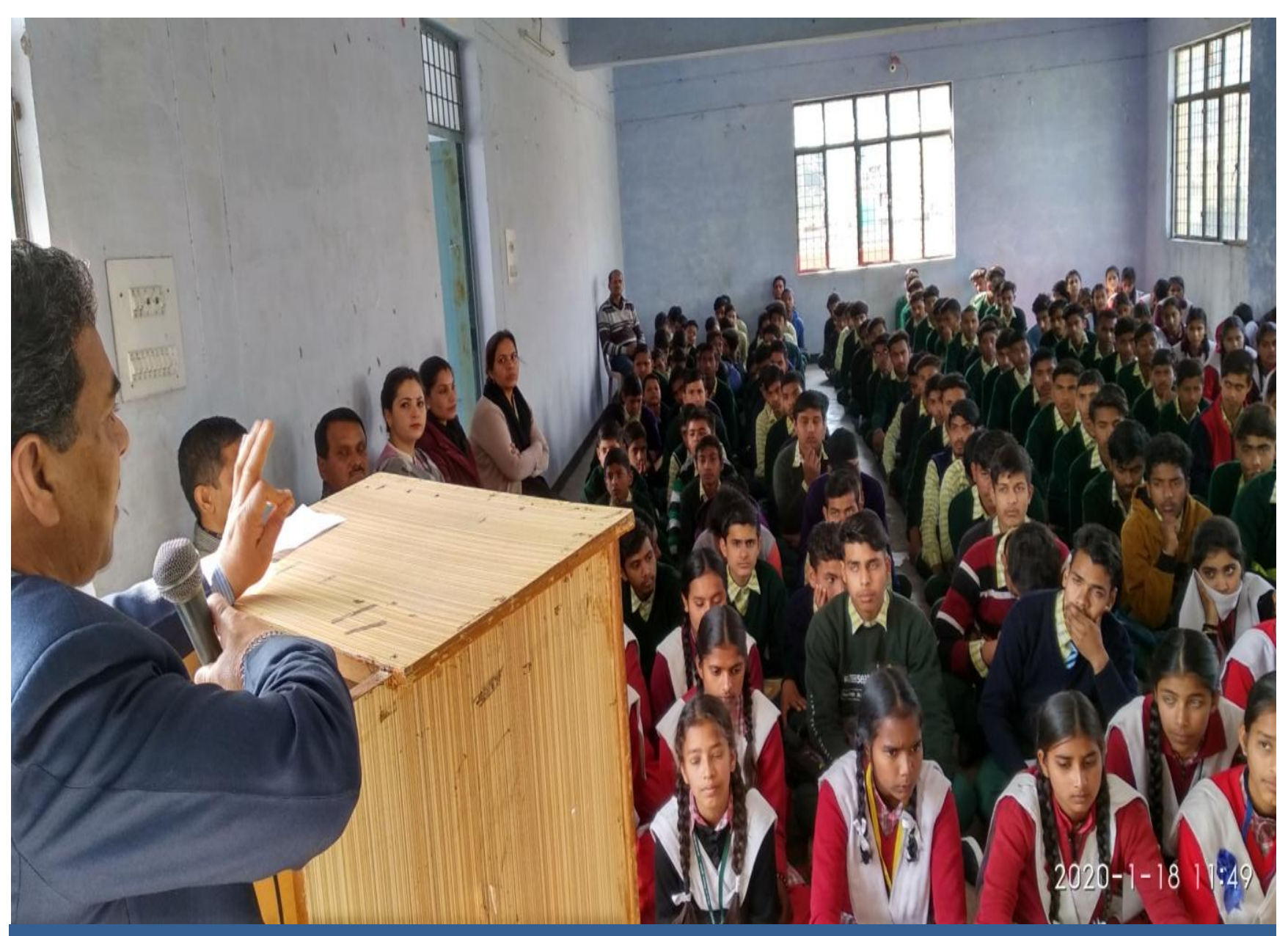
Awareness drive on Fundamental Duties in Govt. Sr. Secondary School, Nahan.