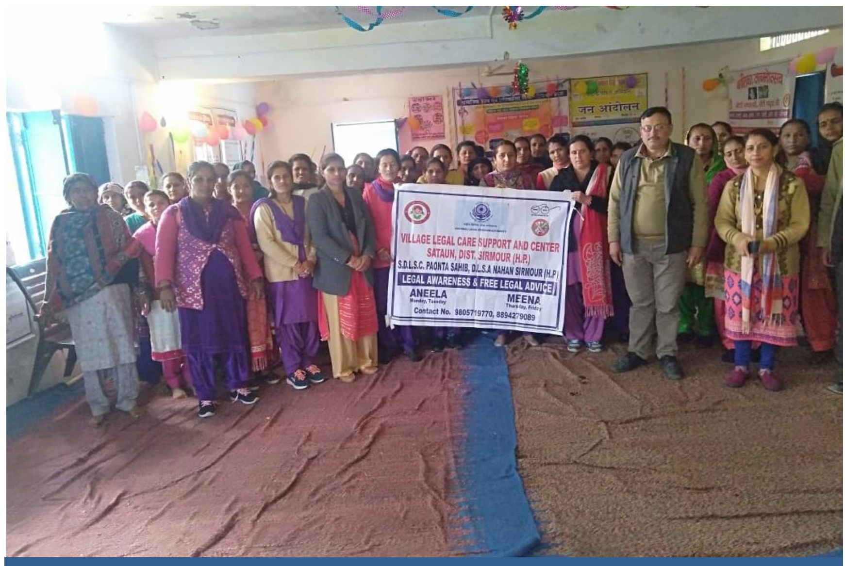
Awareness programmes for aanganwadi karyakarta and Panchayat representatives 0 by the Para Legal Volunteer.