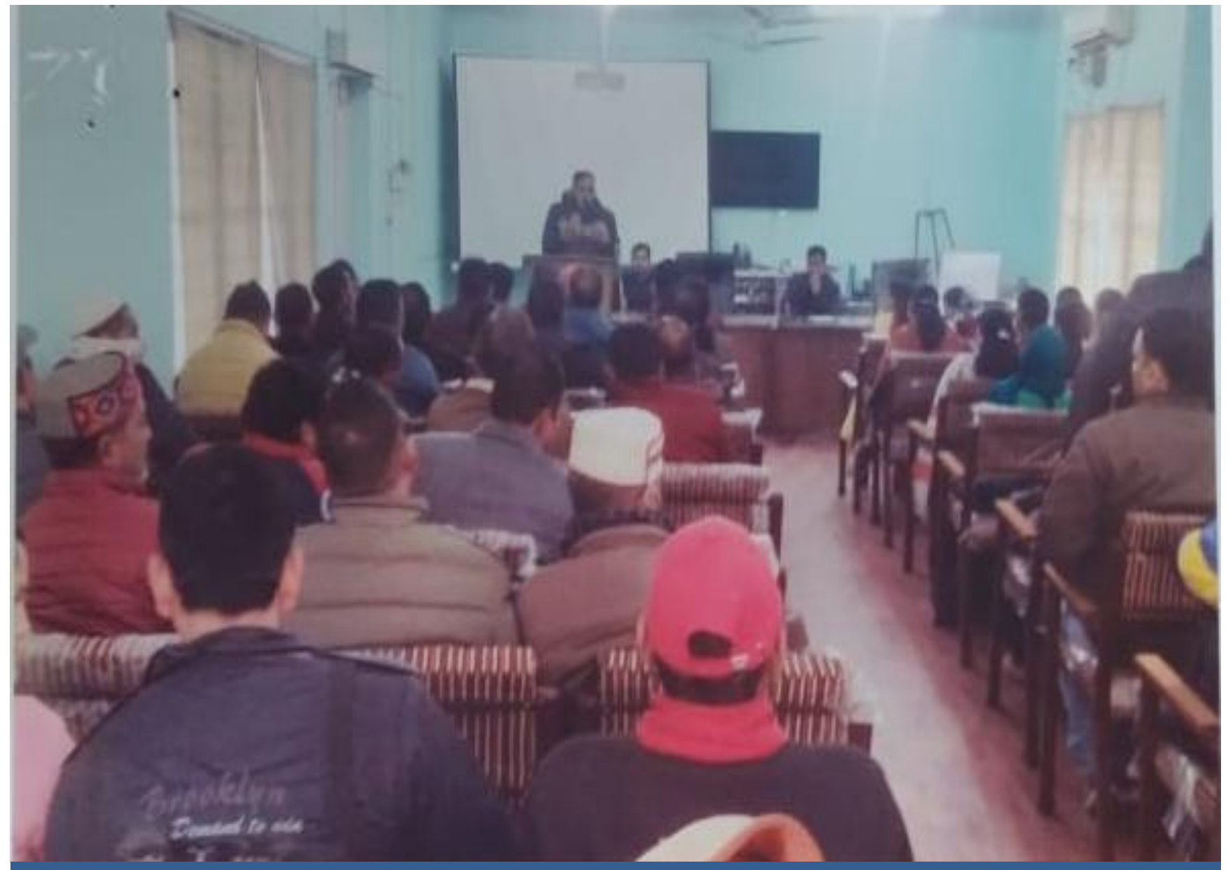
A meet of Panchayat representatives of Chamba Block and a Talk on Preamble of the Constitution of India, Fundamental Duties and Role of Panchayati Raj Institutions in upholding Human Rights.