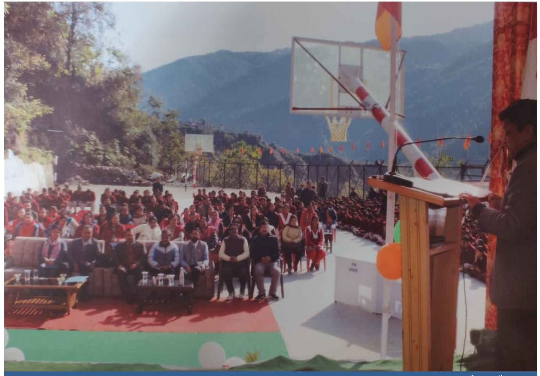
Declamation Contest on "Importance of Fundamental Duties under the Constitution of India for students of 9<sup>th</sup> to 12<sup>th</sup> classes of schools in Sub Division Chamba.