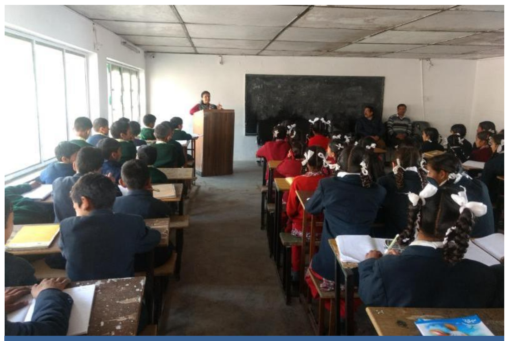
An Awareness Programme on Fundamental Duties organized at Govt. Senior Secondary School Ghanahatti Shimla.