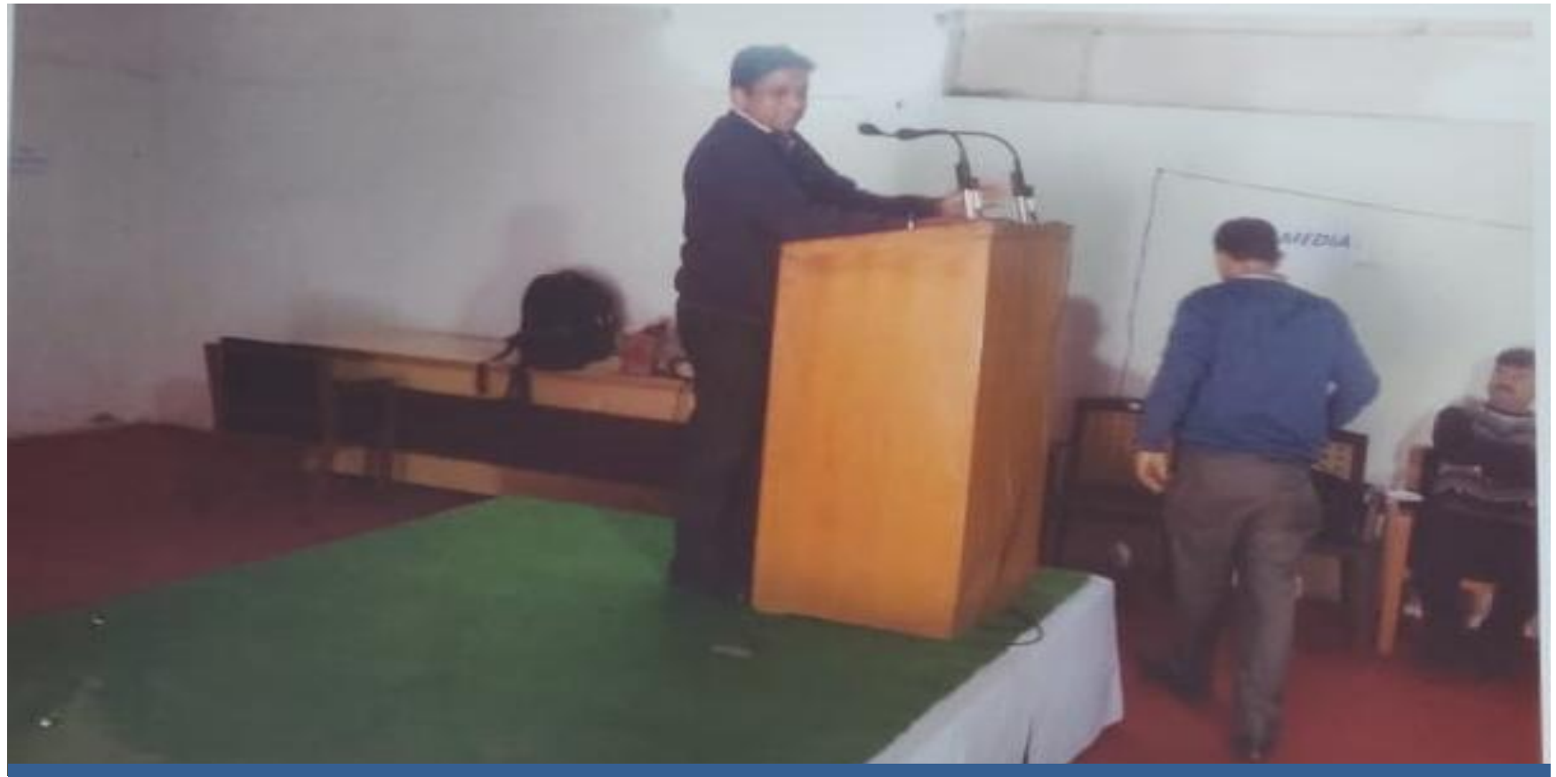
District Meet of Police Officials/Officers and a Talk on Role of Police in enforcing Fundamental as well as Legal Rights of Individuals.