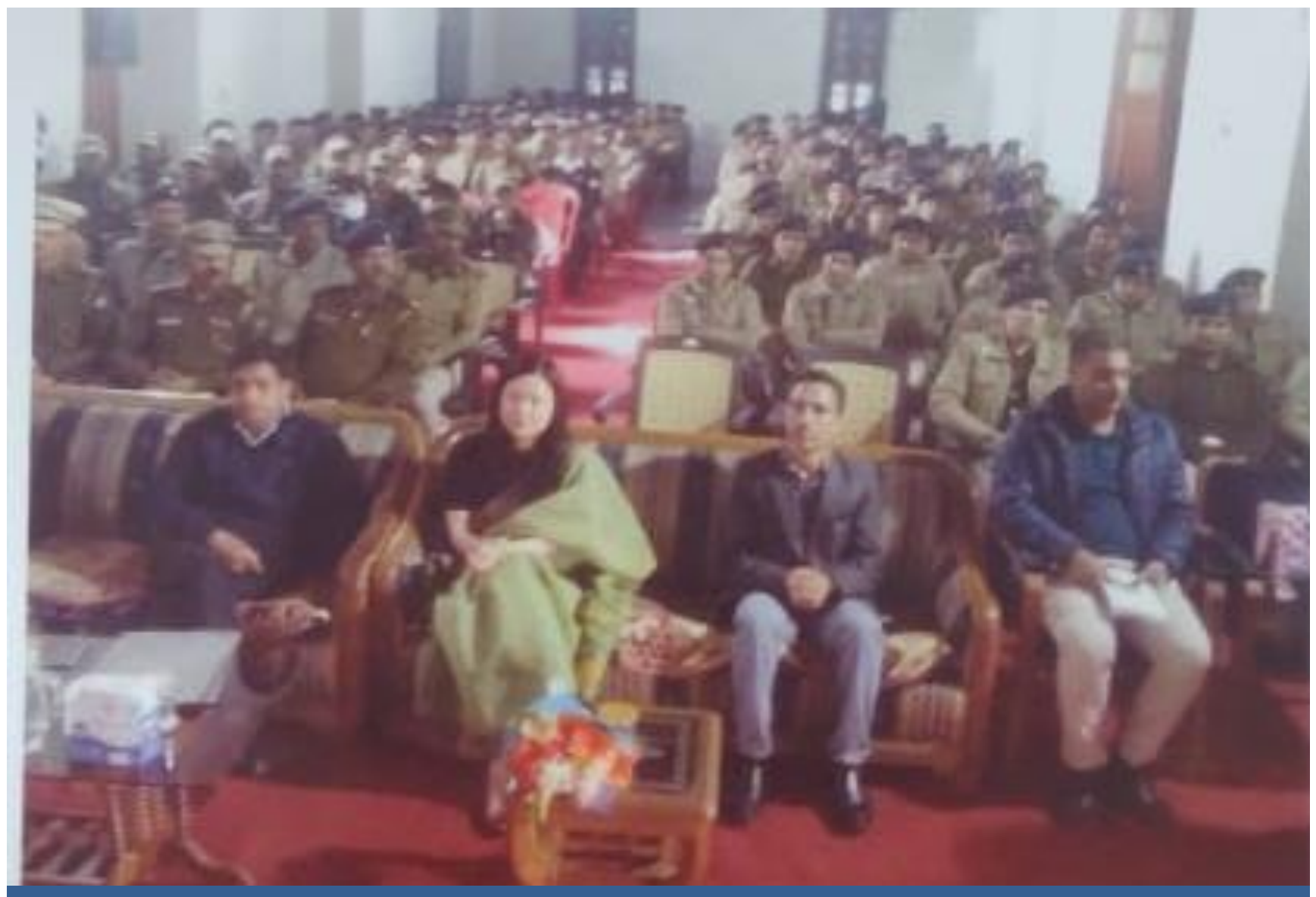
District Meet of Police Officials/Officers and a Talk on Role of Police in enforcing Fundamental as well as Legal Rights of Individuals.