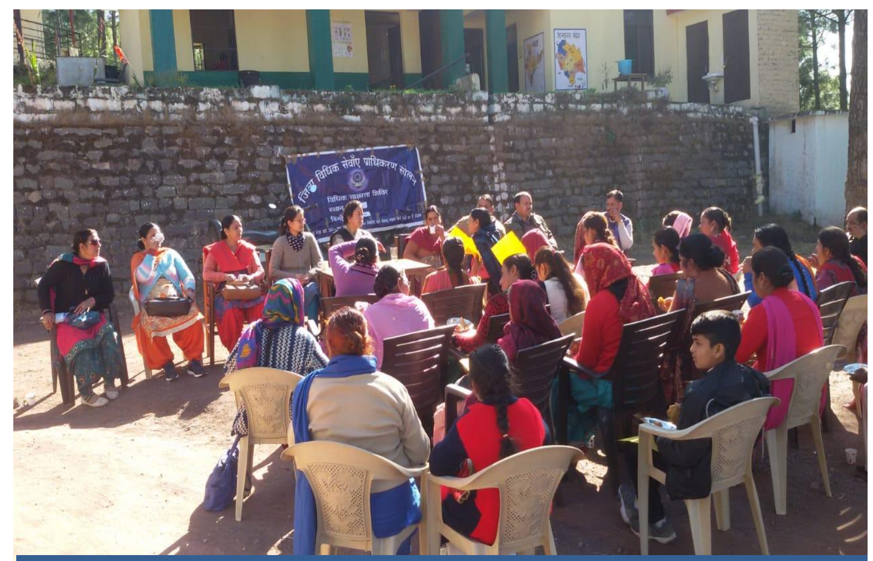
Public Awareness through Talks on Fundamental Duties at Gram Panchayat Anji Matla.