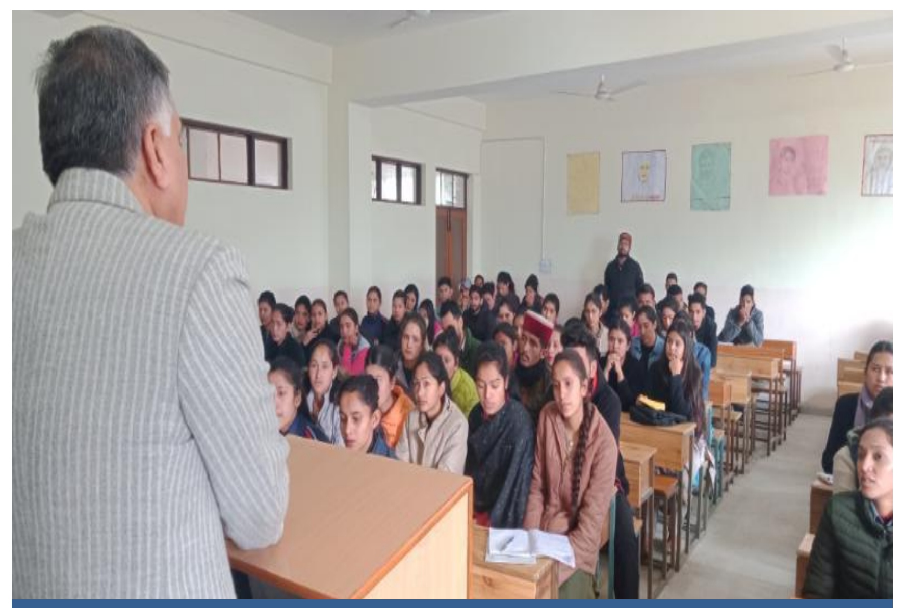
A Legal Awareness Programme on Fundamental Duties organized at Govt. College Kullu