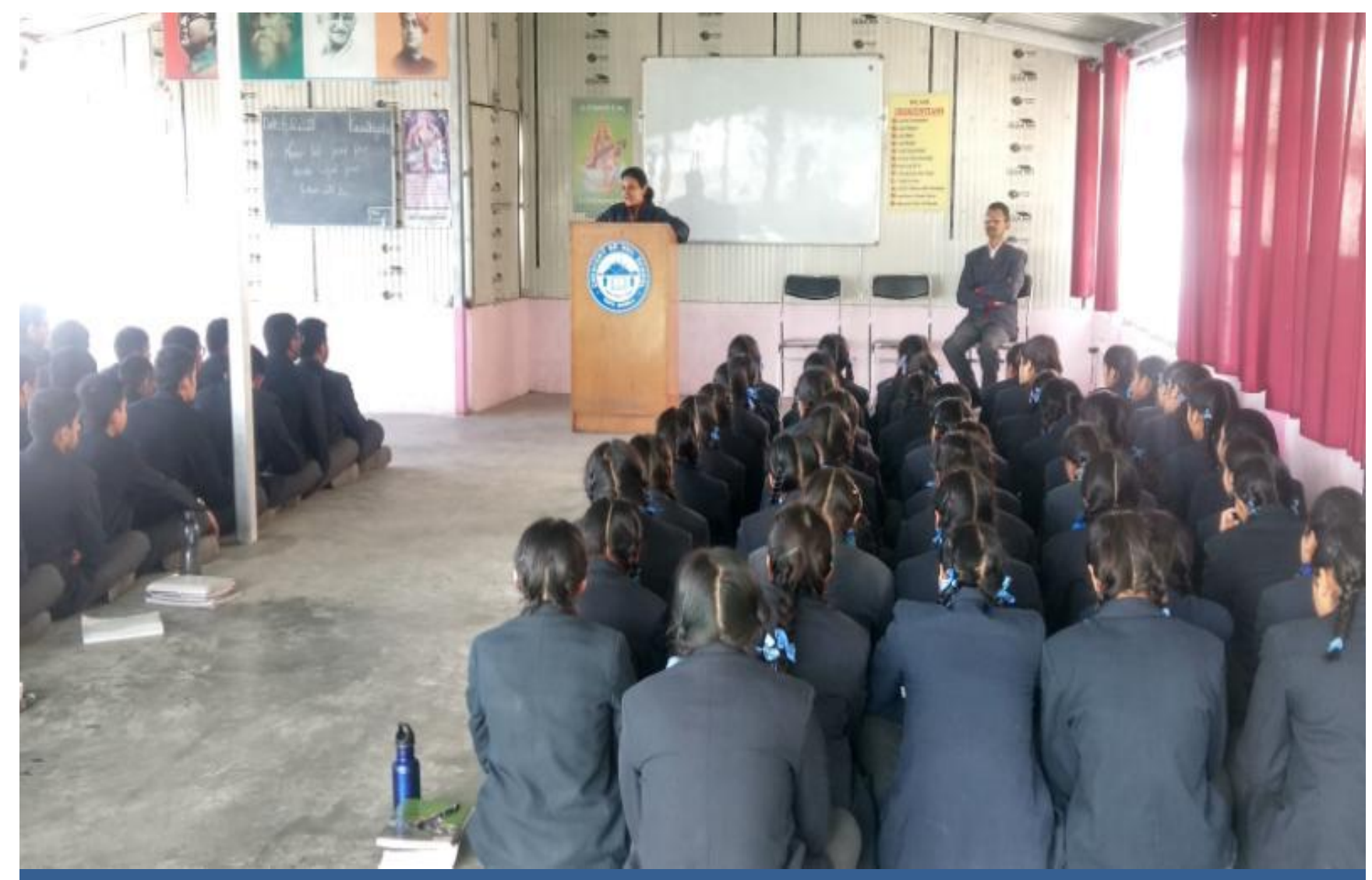
An Awareness Programme on Fundamental Duties organized at Cresent Sr. Sec. School Totu, Shimla.