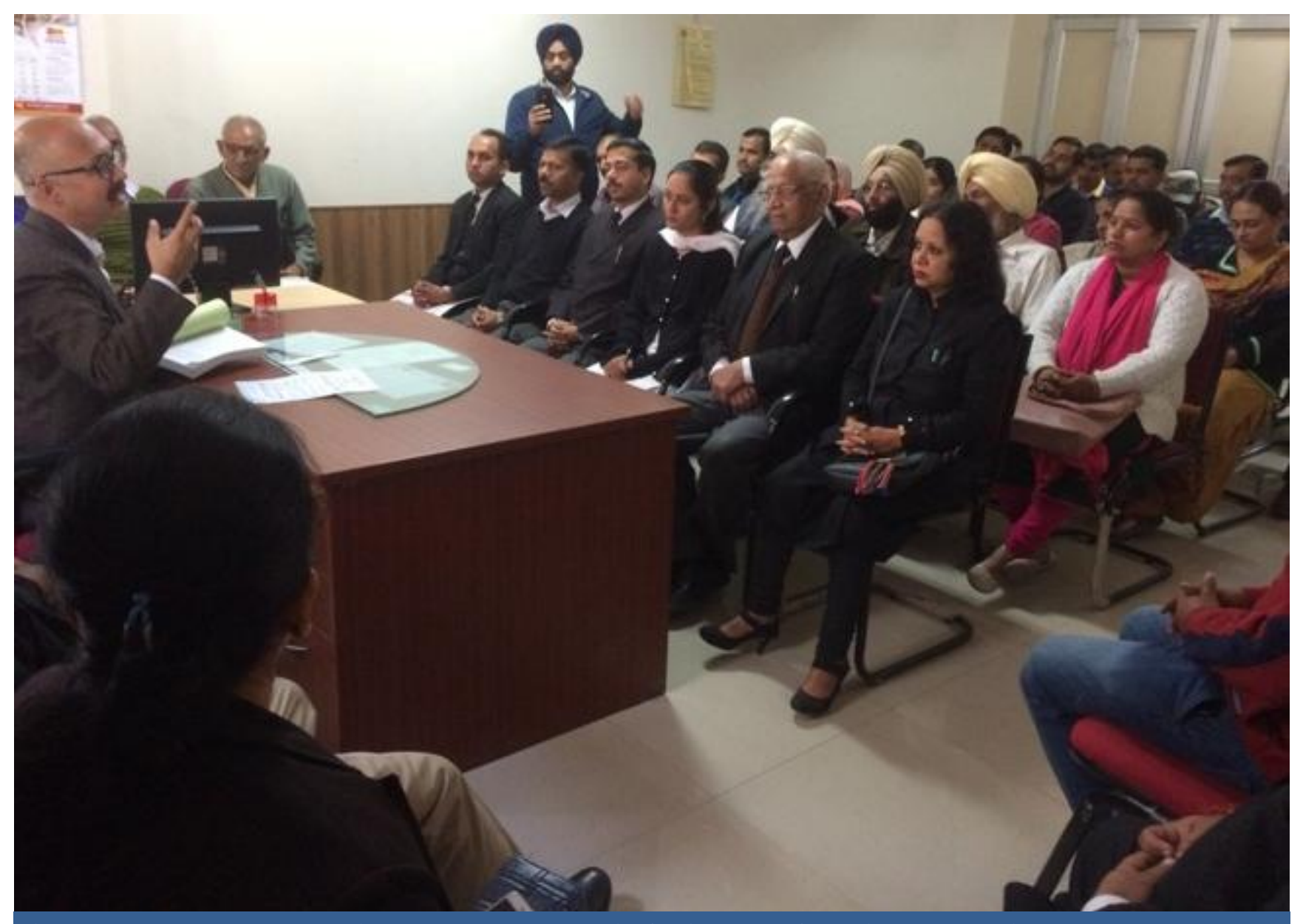
An awareness programme organized on Fundamental Duties for Advocates & Public Representatives.