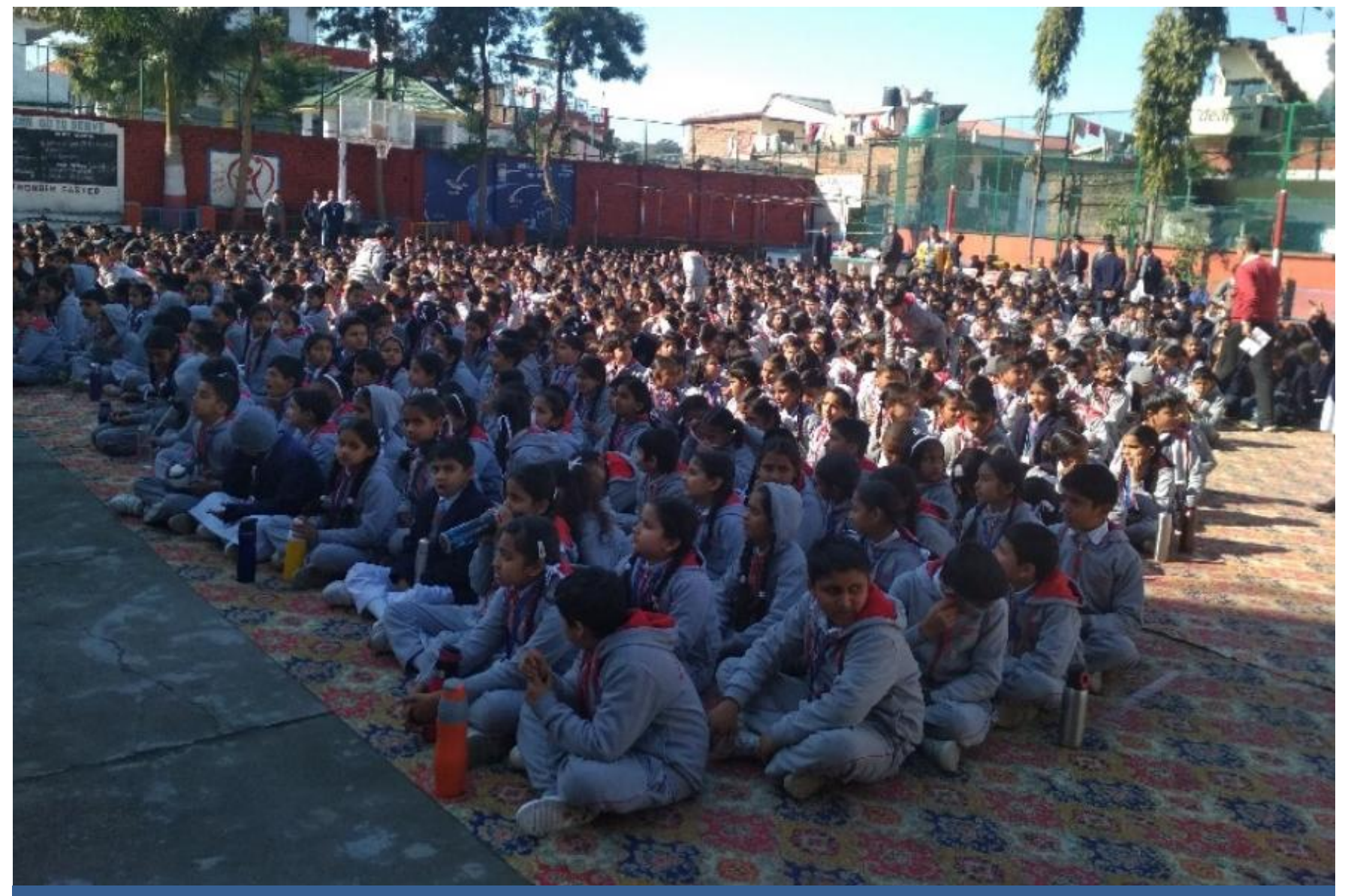
A Mega Camp was also organised on Fundamental Duties by Secretary, DLSA, Kangra at Dharamshala in G.A.V. Public School Kangra on 22/01/2020.