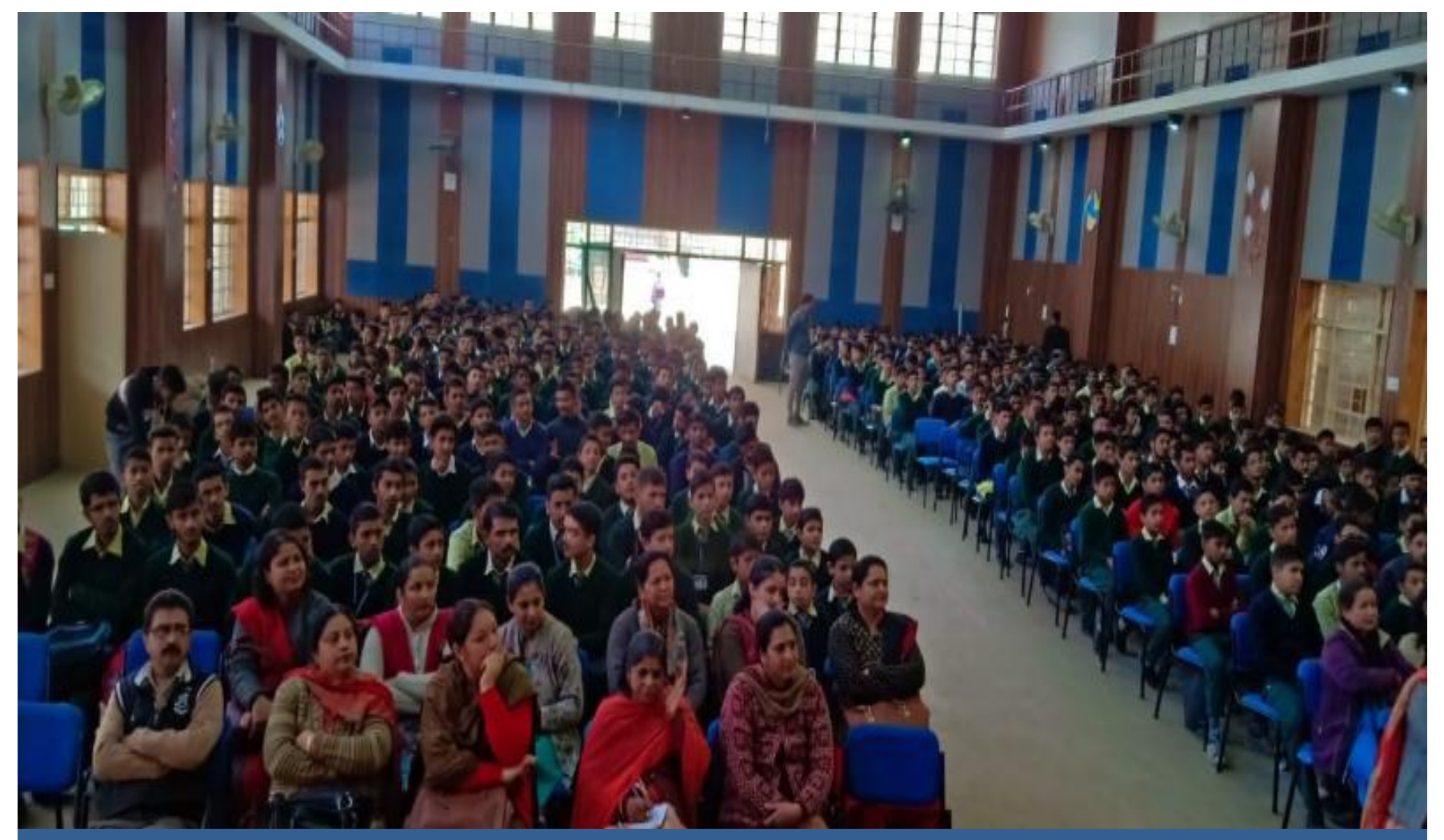
A Legal Literacy Programme on Fundamental Duties and Preamble of Constitution organized at GSSS Nogali.