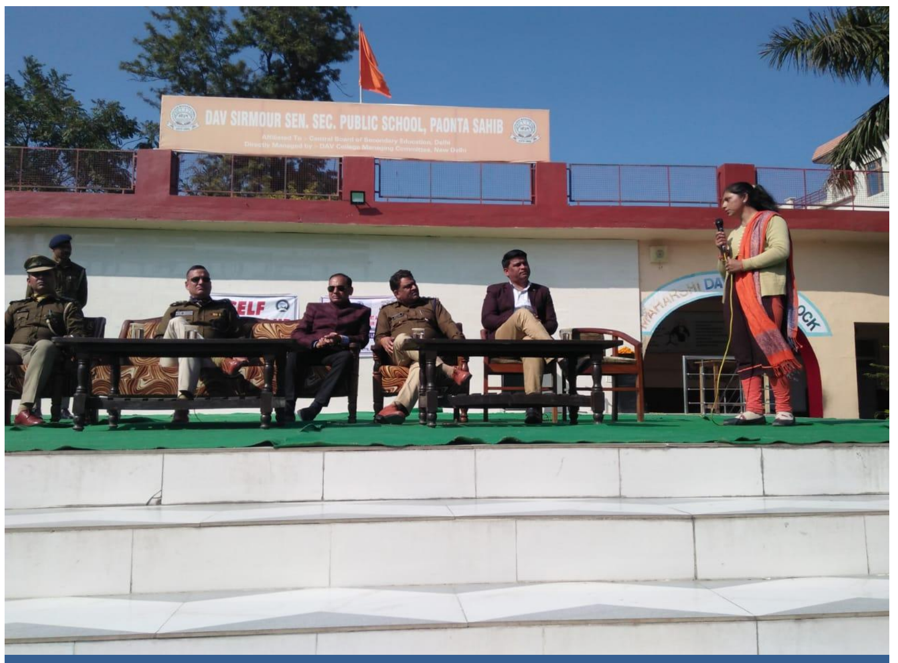
Awareness drive on Fundamental Duties in DAV Sirmour Sr. Secondary Public School, Paonta Sahib.