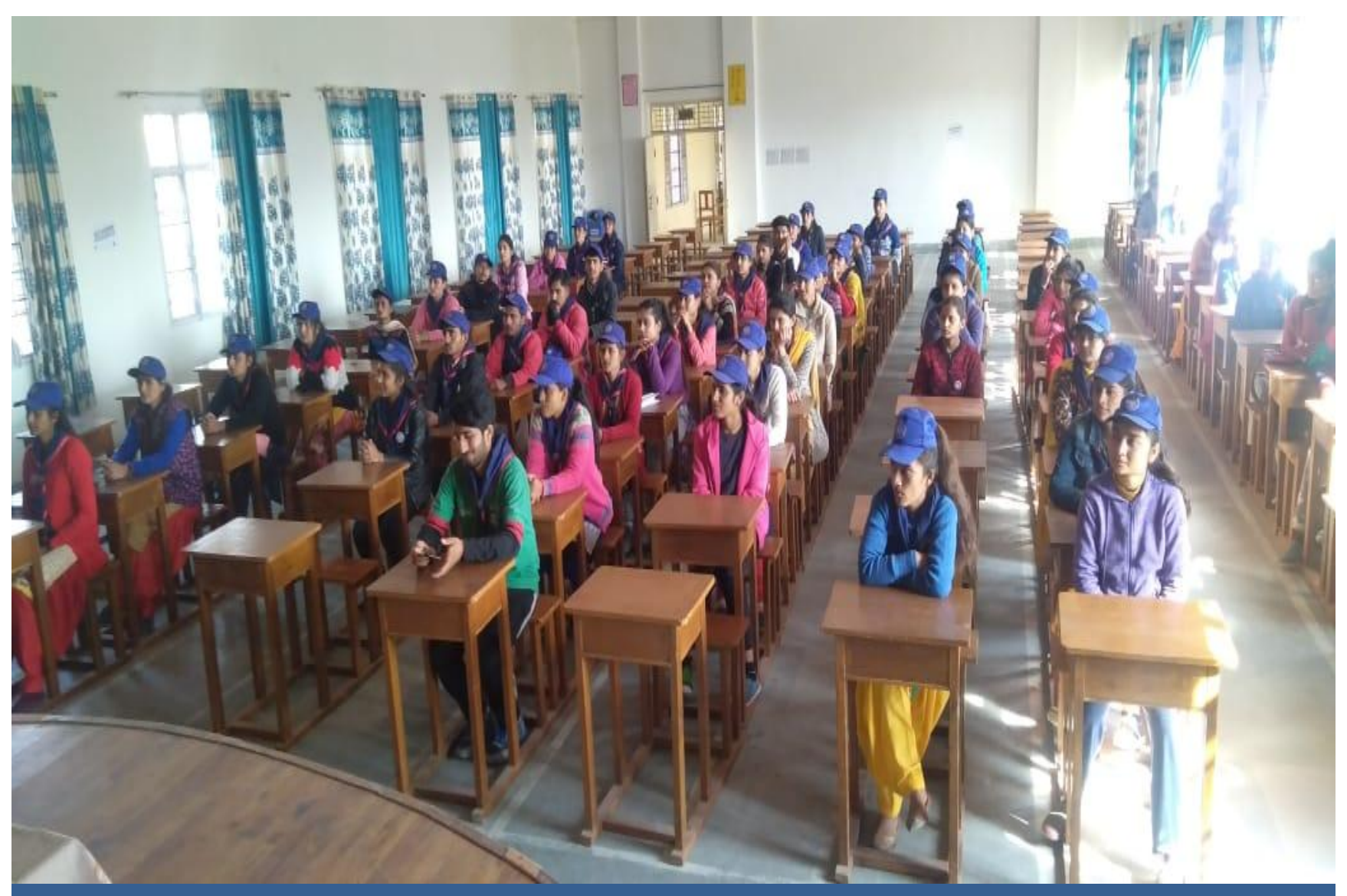
Awareness drive on Fundamental Duties at Nahan.