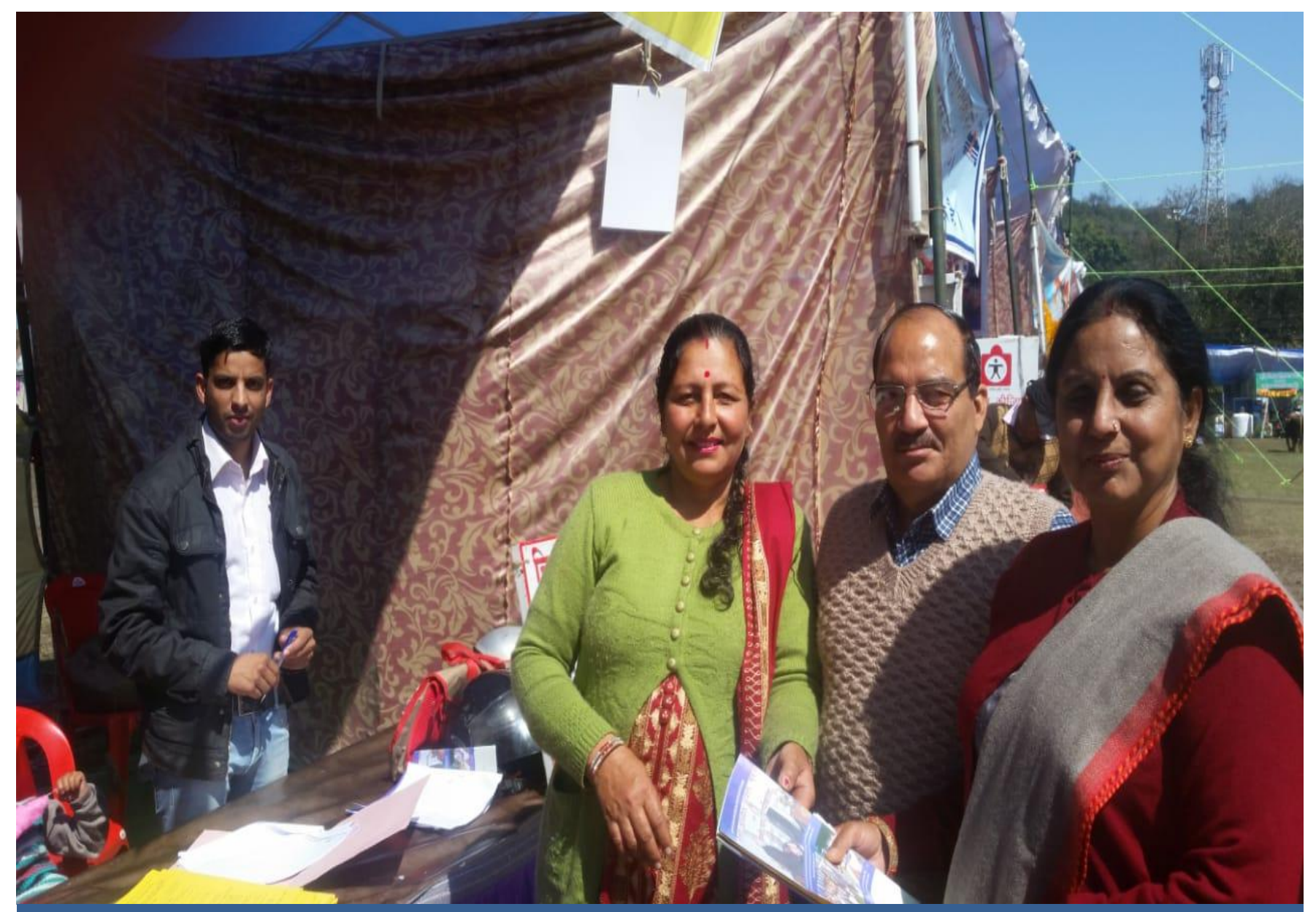
A legal Awareness Camp on Fundamental Duties for general public organized during the Holi Fair at Sujanpur.