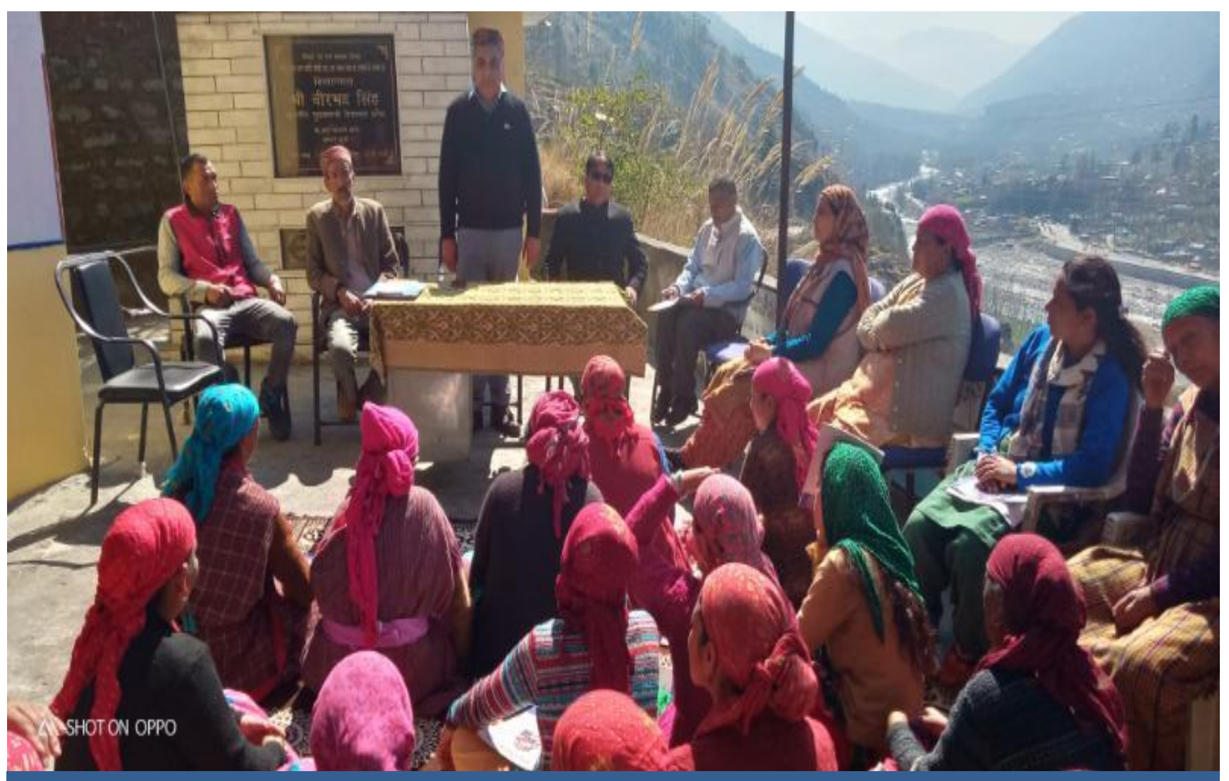
A Legal Awareness Programme on Fundamental Duties organized at Gram Panchayat Achandi.