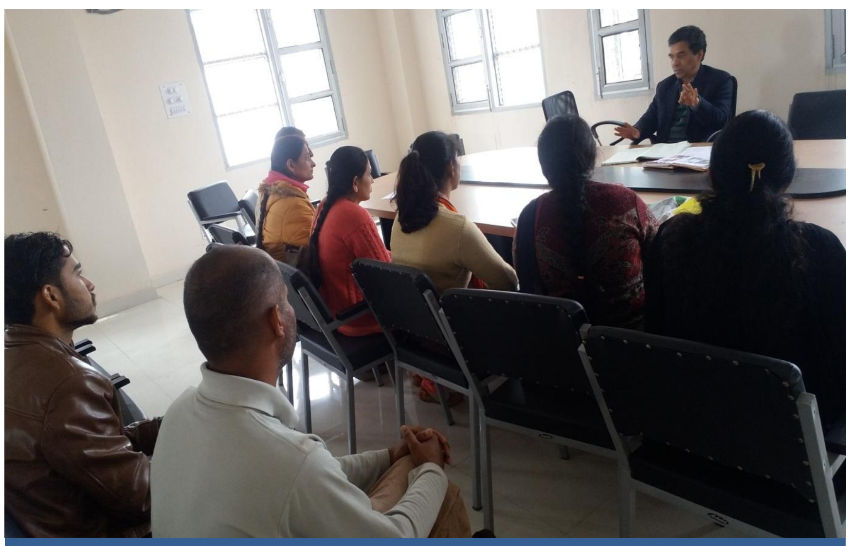
Training of Para Legal Volunteers and Resource Persons on Fundamental Duties and Preamble of the Constitution.